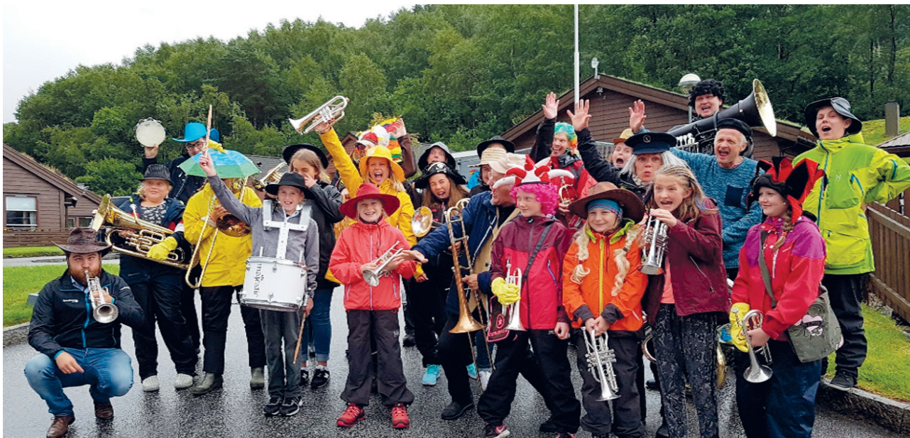
Eikefjord Skulemusikk med Ytre Suløen på Eikefjorddagane.

Gjennom stiftinga sin gåvestrategi har stiftinga prioritert følgjande tiltak: