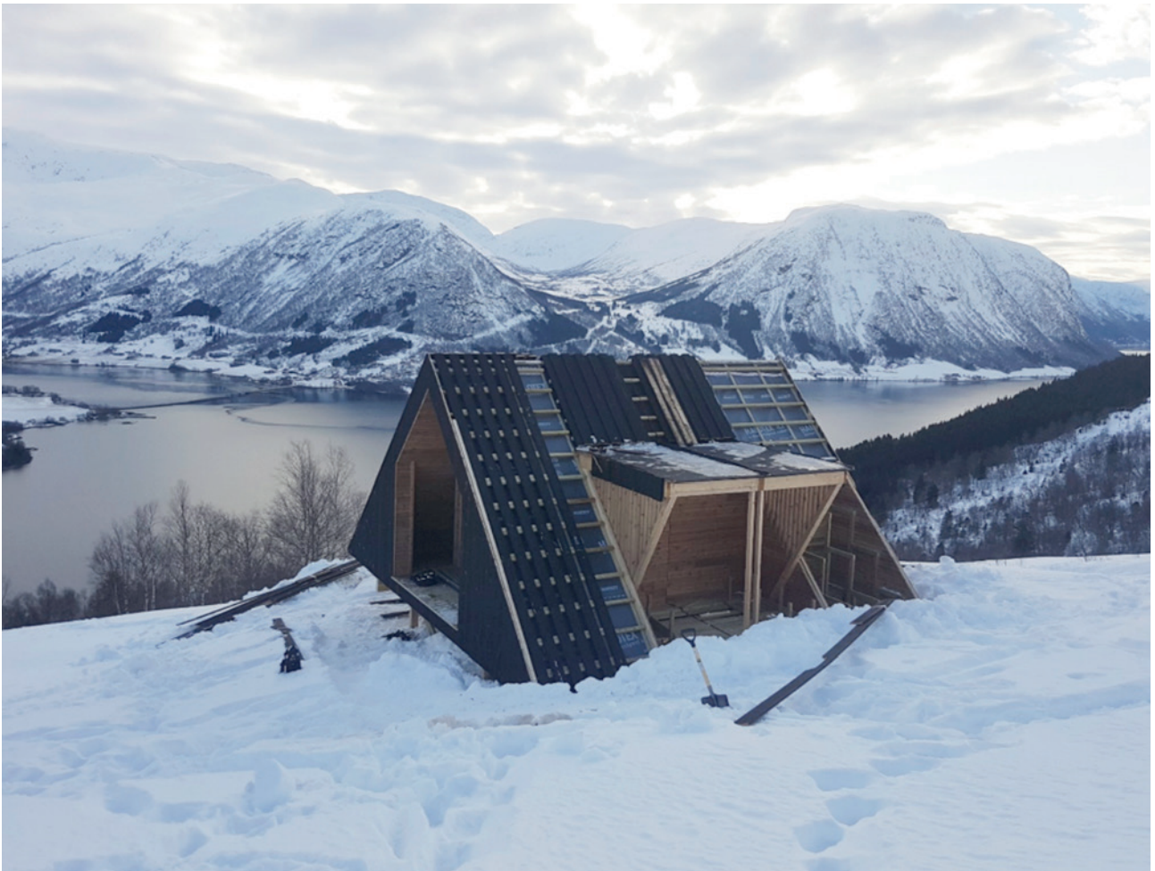
Dagsturhytta «Fjellro» ved Skei i Jølster under oppføring.

Samtlege kommunar sa seg interessert i ei slik hytte, og i skrivande stund er første hytta opna i «Trivselsskogen» ved Sandane i Gloppen, og mange nye hytter er under oppføring/på veg. Prosjektet har òg fått stor medieinteresse, og målingar har vist at aktiviteten på turmålet aukar når hytteplasseringa vert offentleggjort – allereie før hytta vert plassert ut. Prosjektet vil bli rulla ut så raskt som mogeg, dvs. at hytte i alle 26 kommunane skal vere plassert ut i løpet av 2019.